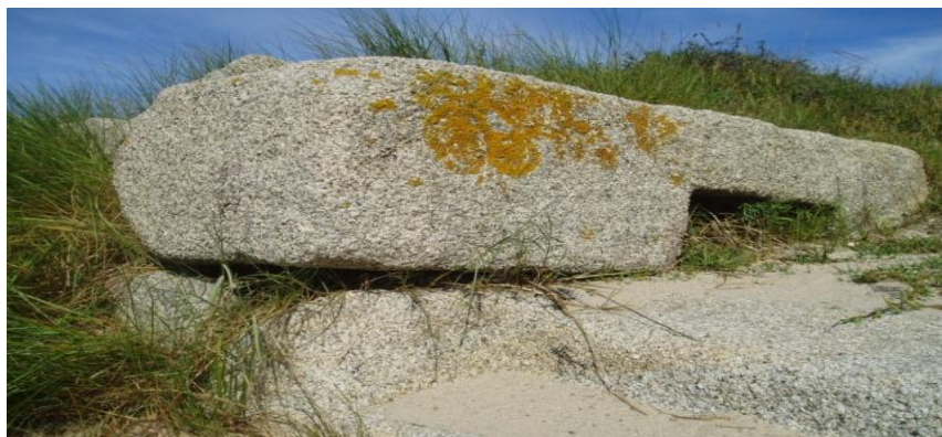
Pedras de cantería situadas na parte posterior do peirao vello da Covasa