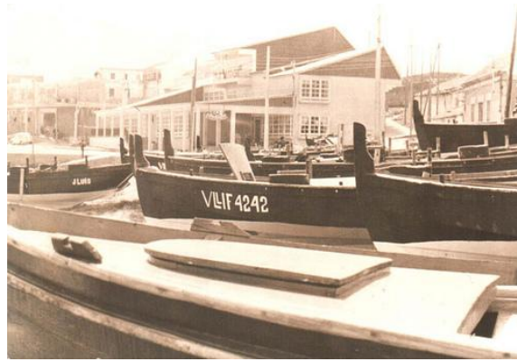
Confraría de pescadores de Carreira e Aguiño

Coordenadas GPS: N42.31.271 - W09.01.158.