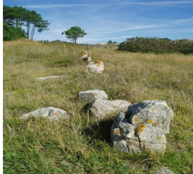
Vestixios do antigo almacén

Pechando o peirao en terra firme apreciase un muro de máis de 20 metros de longo construído con grandes anacos de granito dispostos transversalmente ao peirao, e onde se aprecian rebaixos que parecen corresponderse con restos de canalizacións, así como dun sistema de acceso escalonado.