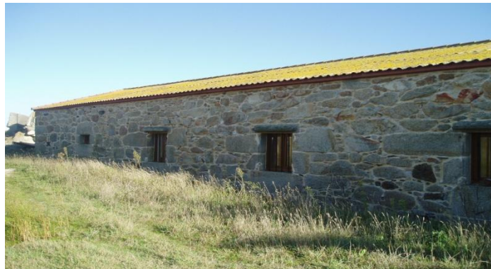
Parte traseira do almacén de salazón

Coordenadas GPS: N42.31.209 - W09.02.321.