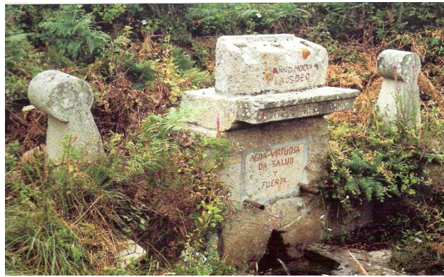
Fonte da Telleira rebautizada como Santa Catalina

Posteriormente, esta fonte foi rebautizada co nome de Santa Catalina, por influencia da lenda desta Santa, que fuxindo dos seus perseguidores abriu unha cova cerca da fonte, que uniría a illa coa terra firme.