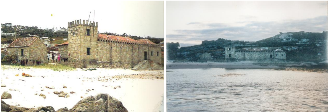
Almacén de Sálvora

En 1770 o comerciante coruñés Jerónimo de Hijosa establece en Sálvora a primeira fábrica de secado e salgadura de peixe. Posteriormente no 1960, engadíronselle dúas torres que a converterían no famoso Pazo de Sálvora coñecido popularmente como o "Almacén". O emprazamento xeográfico da illa resultaba perfecto para as tarefas de desembarco, especialmente pola ausencia de infraestruturas portuarias no actual pobo de Aguiño.