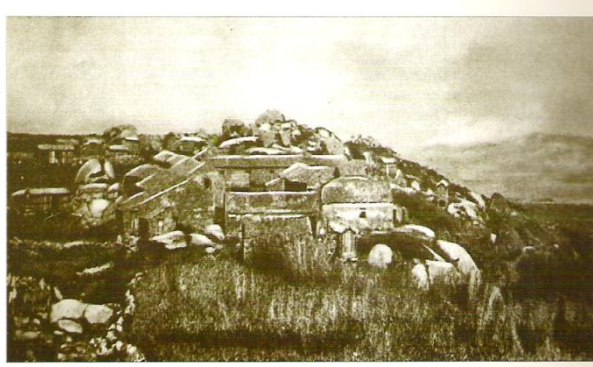
Poboado de Sálvora, en 1921