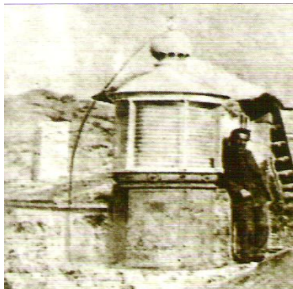
Primeiro faro de Sálvora e fareiro

Na parte máis meridional da illa constrúese en maio de 1852 o primeiro faro de Sálvora. A obra custou cincuenta e catro mil oitocentos catro reais. A iluminación producíase mediante a queima de aceite. Así comezou a vida do faro que en 1880 era xa capaz de alumear con luz vermella os baixos de Corrubedo.