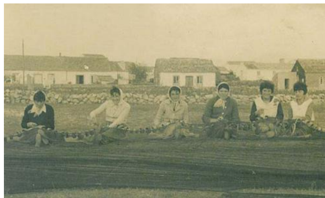
Redeiras fiando fronte os almacéns dos cataláns