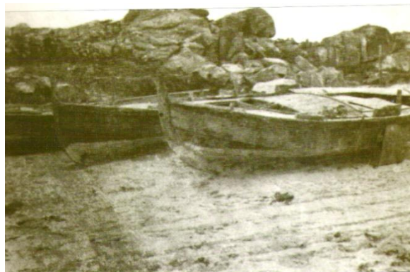
Dornas varadas na praia dos Bois, en 1921

Nesta praia acostumaban a varar as súas dornas os mariñeiros que a comezos do século XX empezaron a ocupar á illa.