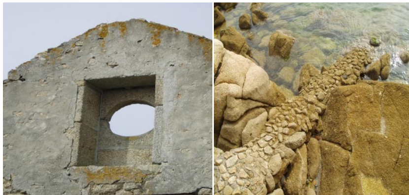
Detalle do ollo de boi da casa