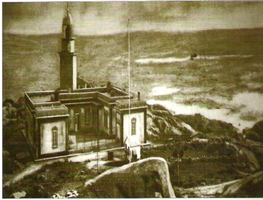
Inauguración do faro en 1921