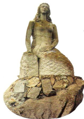
Serea de Sálvora