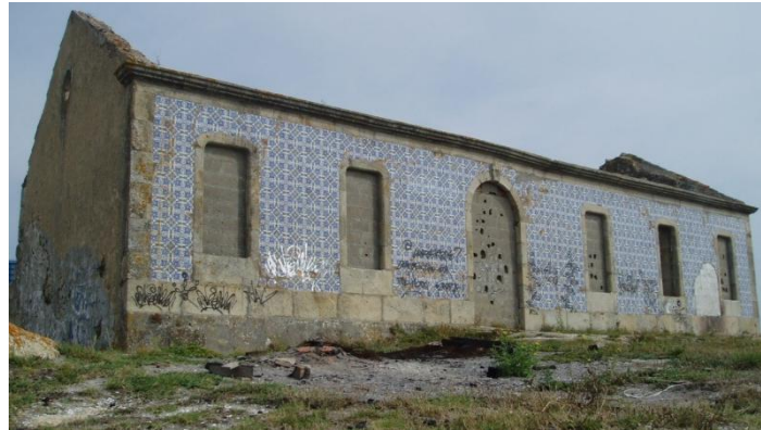
Fachada principal da casa

Actualmente, so permanece en pé a fachada principal da casa, que aínda amosa o seu pasado glorioso a través da súa decoración con fermosos azulexos.