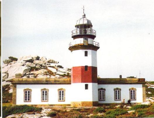
Actual faro remodelado en 1954