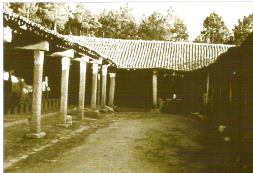
Patio onde estaban os píos e as prensas

Na parte interna do almacén de Sálvora atopábanse os píos para o salgado da sardiña e máis as prensas, que se utilizaban para o seu envasado. Nos redondos tabais de madeira as sardiñas e máis os arenques estaban colocados circularmente coa cabeza mirando ao exterior.