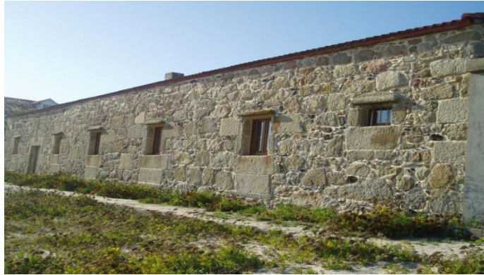
Antigo almacén que pertenceu á familia Malrés

Na zona de Couso proliferaron tamén unha serie de almacéns e conserveiras que tiveron unha importancia enorme na economía de Aguiño. Un deles foi o almacén propiedade da familia Malres na que se salgaba a sardiña a principios de 1800. Posteriormente pasou a mans doutros propietarios que a converteron nunha conserveira. Neste momento podían estar a traballar nela máis de duascenas mulleres. Hai unha década foi convertido nun restaurante que pechou hai uns anos.