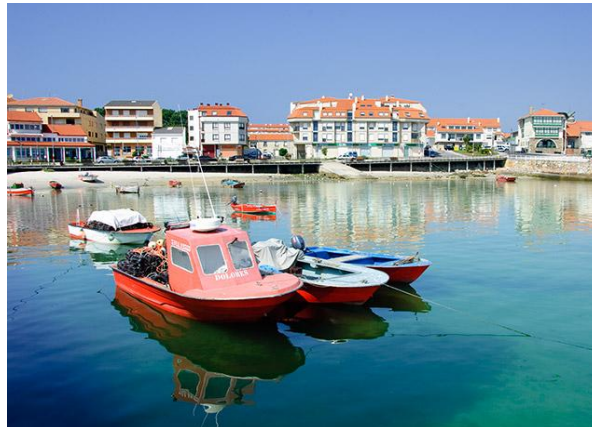
Actual fachada do pobo de Aguiño