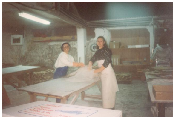
Dúas mulleres traballando no almacén de Colomer

Un dos almacéns máis famosos foi o de Colomer. Nel traballaron moitas mulleres no secado do bacallau a partires da década dos 50. Actualmente, o seu lugar ocúpa un grande edificio de vivendas.