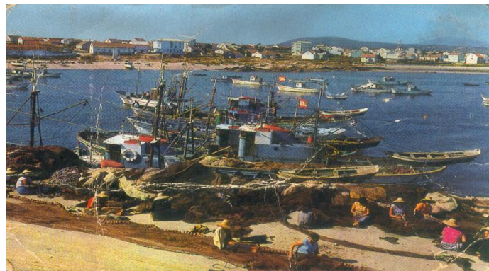
Redeiras fiando no peirao

As novas edificacións non permiten observar os antigos emprazamentos dos almacéns, pero si o lugar estratéxico elixido polos fomentadores cataláns.