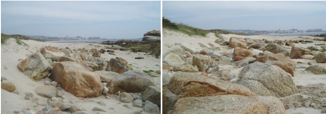
Vestixios de pedra que conformaban no seu tempo a fábrica da Catía

A salgadura e o afumado levábase a cabo nos lagares, unhas bodegas situadas nas proximidades das ribeiras do mar, como o almacén da Catía. Actualmente, quedan algúns vestixios destas magníficos conxuntos arquitectónicos aínda que outros forman xa parte da historia, como é o caso da fábrica situada na praia da Catía, un almacén de salgadura que deixou de traballar a principios de 1900 e que serviu de teito para varias familias ata que foi abandonada. O almacén estaba situado a pé da praia facilitando os desembarcos da sardiña a bordo das dornas xeiteiras.