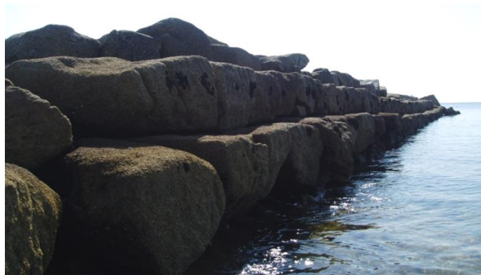
Detalle dos “sillares” do peirao da Covasa