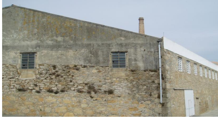
Pinche e fachada principal rehabilitada do secadoiro de congro

Moi preto da antiga casa da familia Barreras atópase a fábrica de Nafonso. Inicialmente esta fábrica foi un secadoiro de congro e posteriormente unha conserveira. Na actualidade, está totalmente reformada e rehabilitada e é unha das industrias conserveiras que aínda traballa na comarca.