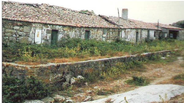
Poboado de Sálvora, abandonado na actualidade