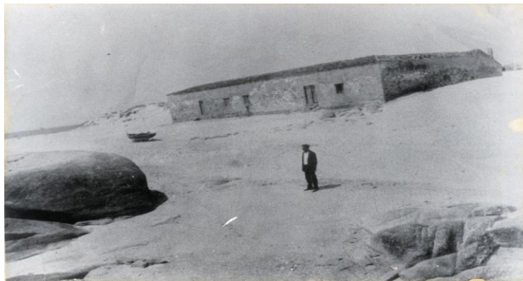
Antigo e orixinal almacén da Catía