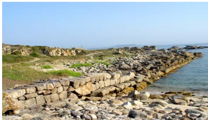
Vista xeral do antigo peirao da Covasa

Segundo algúns estudos, este peirao puido ser construído polos comerciantes fenicios entre os séculos XII e VIII a. C. cando este pobo de Oriente Medio se atopaba no esplendor do seu éxito no tráfico de compra e venda de mercadorías e necesitaba un porto franco onde facer escala. Sen dúbida desta interpretación, o certo é que foi empregado polos fomentadores cataláns para o desembarco das capturas.