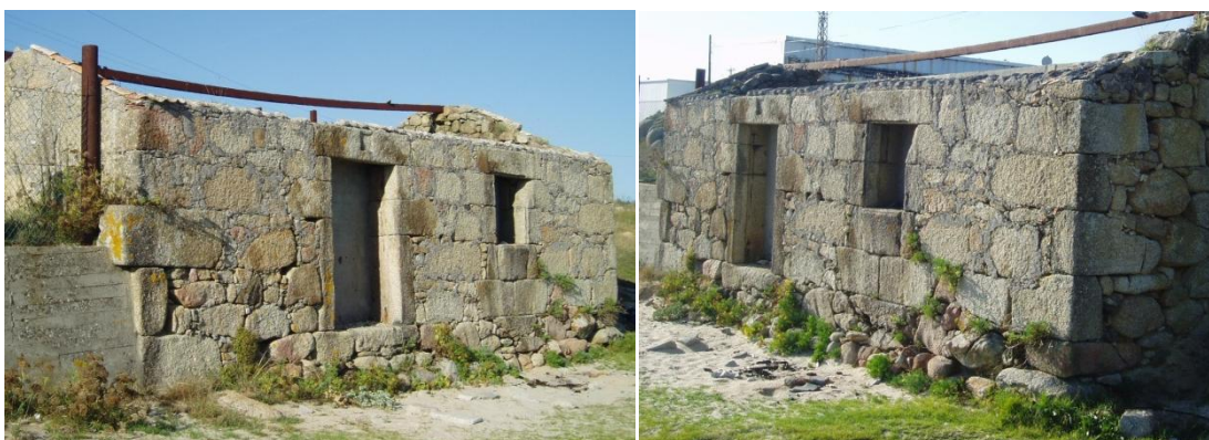
Antigo alpendre a carón do antigo almacén en Couso