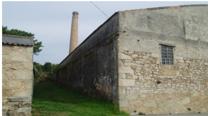
Detalle da antiga cheminea do secadoiro e da conserveira.